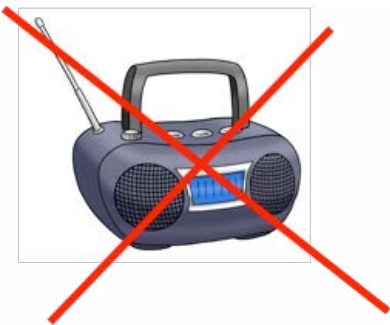
Bild: Lebenshilfe für Menschen mit geistiger Behinderung Bremen e.V., Illustrator Stefan Albers, Atelier Fleetinsel, 2013